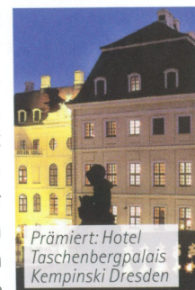
Prämiert: Hotel Taschenbergpalais Kempinski Dresden

Die USA machen vor, was auch in Deutschland Standard sein sollte: Mit dem „United States Hotel and Motel Fire Safety Act“ gibt es dort bereits seit 1990 eine einheitliche Regelung, die die Ausstattung der Hotels mit Sprinkleranlagen vorschreibt. Hierzulande existiert (noch) keine Vorschrift speziell für Hotels, auch wenn der bvfa seit langem fordert, dass Gebäude mit Publikumsverkehr mit technischen Brand-